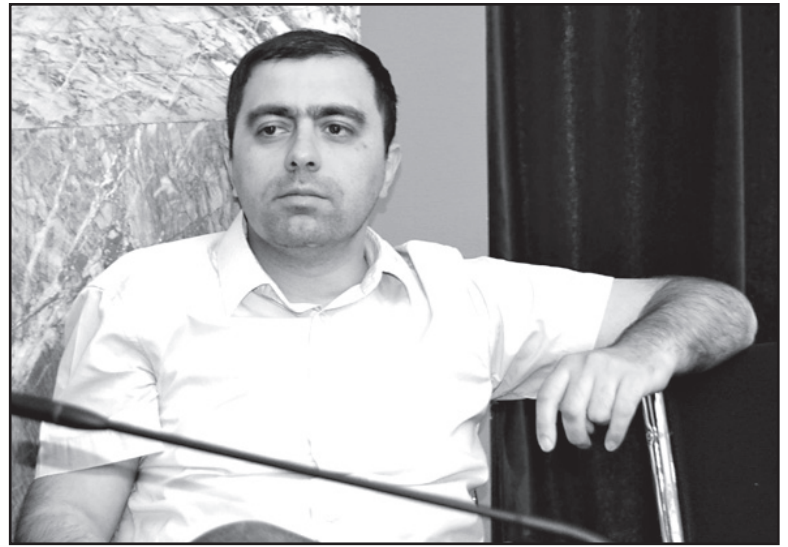
ჩენას. ამომრჩევლებს მოსყიდვან?

– არა მხოლოდ 2020-ს, ეს არის ივანიშვილის მართვის მოდელი. ხშირად ვადარებთ ხოლმე შევარდნაძის მართვის მოდელს. ეს არის ფავორიტიზმი, რომელიც გულისხმობს იმას, რომ მოკლე პერიოდით ის ნიშნავს თავის ფავორიტებს და რატომ მოკლე პერიოდით? იმიტომ, რომ რომელიმე მათგანი არ გაძლიერდეს და შემდეგ ამირისპირებს მათ სხვა ფავორიტებს. აი, ეს სისტემაა და, არა მგონია, ამ სექტემბერ 2020-მდე გაძლოს, მით უფრო, რომ ამჟამად ძალიან სუსტი პაიკები გამოუვიდა ივანიშვილს წინ წამოწეული: ბახტაძე, კობახიძე, ლარიბაშვილი. საზოგადოებაში ეს ღიმილს იწვევს და რაიმე სერიოზულ მოლოდინებს არ აღძვრავს.