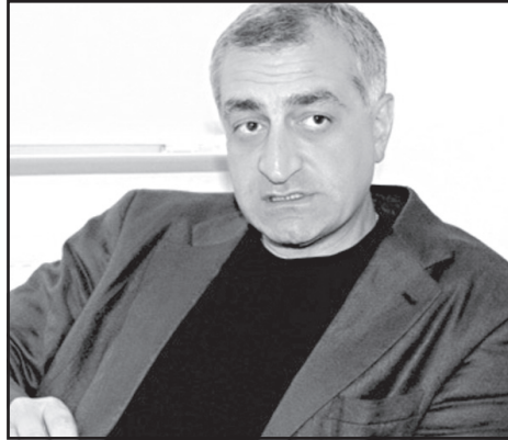
სერიოზული პრობლემა ამ კუთხით?

ატერორებენ თუ არა ბიზნესს საქართველოში, რატომ ალაპარაკდა ბიზნესმენთა ნაწილი ხელისუფლების მხრიდან ზეწოლაზე, რა ხდება თიბისი ბანკის გარშემო? – „ახალი თაობის“ ამ და სხვა კითხვებს კახა კუკავა პასუხობს.