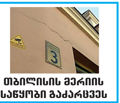
თბილისის მერიის საწყობი გაპარკვას

ბოლნისში განსაკუთრებით ღიღი ოღანოვით ნარკომიკების შექანა- შენახვისთვის 1 პირი დააკავეს