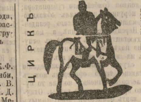
Въ субботу, 17-го декабря, гала-представленіе, состоящее изъ 3-хъ выдающихся дѣйствій. Участвуютъ знаменитые летящіе люди бр. Матеусъ. Выздѣ жюкея Курто. Выздѣ всѣхъ клоуновъ. Выздѣ лучшихъ наездницъ. Въ заключеніе большая обставочная пантомима: «ПОСЛѢ БАЛА». Участвуютъ до 60 персонъ съ кордебалетомъ, при участіи прямо-балеринъ м-лле Рудольфи. Подробности въ программахъ. Начало въ 8 1/2 час. вечера. 811 1.

Въ конторѣ дирекціи театра принимаются частныя объявленія для напечатанія ежедневно на программахъ театра. К. 650 1.