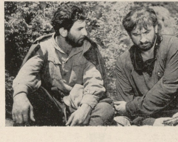
"ქიაკოკონა", სტენარი ს. ჟღენტისა, რეჟისორი ი. ქავთარაძე, როლებში და აბაშიძე, ი. უჩანეიშვილი (ზემოთ), ლ. გლიავა და გ. თობაძე