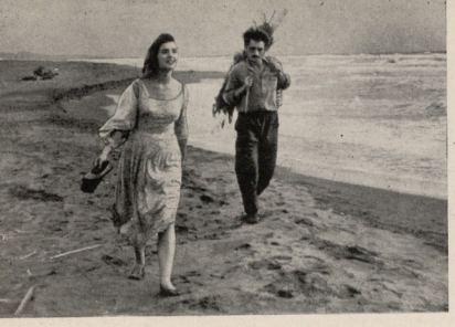
"საულიას ბედი", სცენარი დ. შენგელაიასი, რეჟისორი რ. ჩხვიძე. როლებში ზ. ბოცვაძე, ბ. გოგინავა