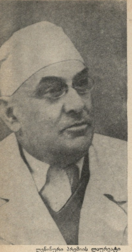
ლენინური პრემიის ლაურეატი პროფესორი ნიკოლოზ ანთელავა

უკანახკნელ წლებში ხაბჭოთა ქი რურგიას დიდი მიღწევები აქვს. ეს ძირითადად შეეხება გულ-მკერდის ორგანოთა ქირურგიული მეთოდებით მკურნალობას. ჯერ კიდეგ ახლო წარხულში გულ-მკერდის ორგანოები ფილტვები, გული, შუახაყარი,ქირურ გებისათვის აკრძალულ ზონად რჩებო და. მედიცინის უკანასკნელი წლების მიღწევებმა —ფილტვებისა და გულის ფიზიოლოგიისა და პათოლოგიის ღრმად შესწავლამ, გაუტკივარების სრულყოფილი მეთოდებისა და შოკის საწინააღმდეგო ეფექტური ლონისძიებების დამუშავებამ, ანტიბიოტიკების აღმოჩენამ, ოპერატიული ტექნიკის გაუმჯობისებამ, აგრეთვი ქირურ გიული კლინიკების ხპეციალური აპარატებითა და ინსტრუმენტებით გამდიდრებამ — ქირურგებს შესაძლებლობა მისცეს შექრილიყვნენ ამ "აკრძალულ ზონაში". ამის შედეგად გულ-შკერდის ორგანოთა ქირურგია bambobs Famade astos badamos jagშირის მრავალი კლინიკისათვის.