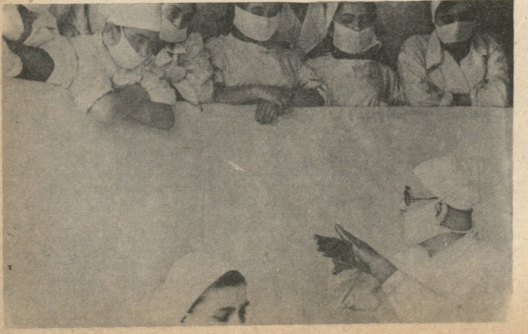
პროფ. ნ. ანთელავა ოპერაციის დაწყებამდე ექიმებს უხსნის ავადმყოფის მდგომარეობას

ამის შემდეგ იწყება მეცნიერის უფრო ნაყოფიერი მუშაობა. იგი სწავლობს და ამუშავებს არა მარტო დუმერკულოზის, არამედ ფილტვების სხვა დააგადებების, გულახა და შუახავარის ქირურგიფლი მეთოდებით მკურნალობას. ყოველწლიურად გროვდება გამოცდილება, მდიდრდება დაკვირვებები და ნ., ანოელავა ზედიზედ სეემს მონოგრაფიებსა და სახელმძღვანელოებს, რომლენმაც მას სახელი გაუთქვეს არა მარტო საბჭოთა კავშირში, არამედ მის საზღვრებს გარეთაც, ერთ-ერთ მრომას მიენიგა ს. ნ. ფეოდოროვის სახელო-