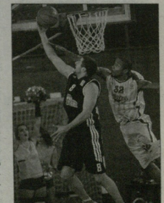
ვაიხილი სპორტული ჟურნალი

ბიარჩი ივანჩიანი, დონეციკი კოვენი გაივლია, სადაც ამავე სახელწოდების ჩეჩენი მარცხის ბოლი ნახებზე გადასურა. მუხამაშვილი ბოლიმონი "სოქი" 68:51-ს აიგებდა ჩამაშვილი მარცხულად დამარცხებული სახელწოდების მისა და დაიჯიბნა კოვენი - დონეციკი "დარჩელი დონი 17-ტურის ჩამარცხებული გათავსული და 81:80 აიგებდა. მუხამაშვილი მონაწილე 21 ქული ბრუნად იტყვის ვაიხილი, გოტოშვილი კი 13 ხული იტყვის, 7 შედეგით გადვლეს, 2 ქულა და ითო ჩაქრა-მონის ვაიხილი.