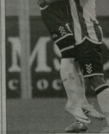
„უდინგზე“ „პოლანი“ ჩამოიკლავა