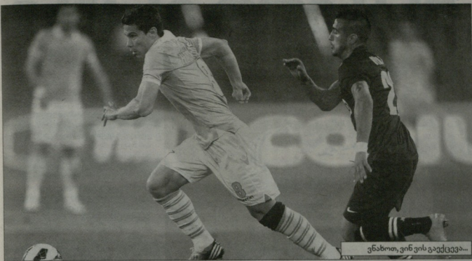
გნაბო, ვინ ვის გადაეცემა?