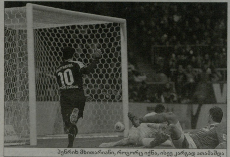
ჟენის მთითარინი, როგორც უჩხა, ისე კრავდე აობამშუა

მ დროს, როცა მონხენის „ბაიერნი“ გერმანიის ჩემპიონობის სარკიოდ დროში განაღდებს კენ ისარაფვის და რეკორდისტიკრის შემწერებელ არავინ ჩანს, ზუნდსლივის მე-20 ტურში ჰამბურგის ცენტრში ორი გუნდი მოექცა: დორტმუნდის „ბორუსია“ პოზიტორი, „შაპტურნი“ კი უკიდურესად დაბეჩავული კლუბი.