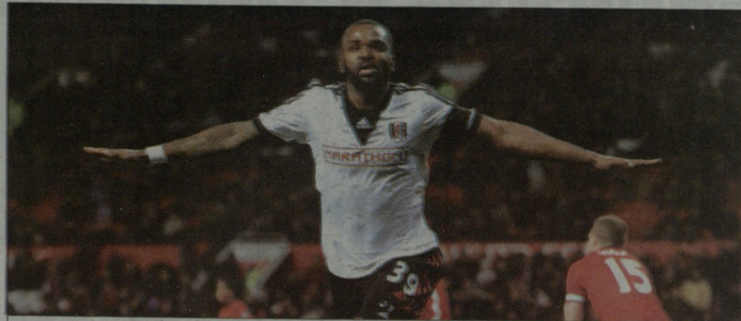
დარენ ბენტიმ ტრაფიცია არ დააღრიდა და ალდ ტრეფორდზე გაიტანა