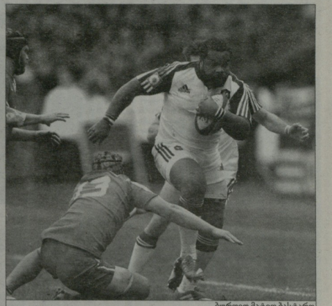
ბურთის მატჩი ბასტარი