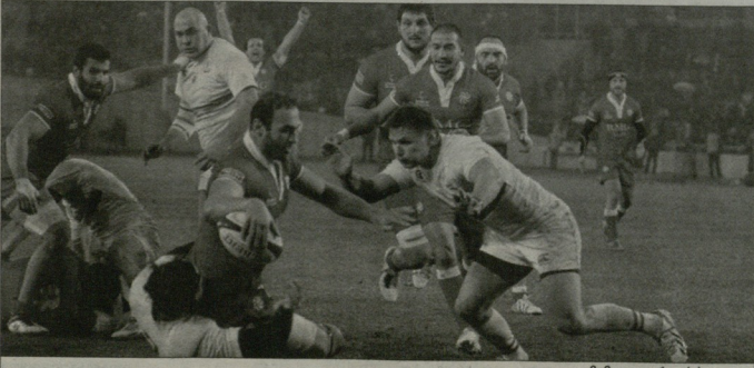
მაშუა გორეობის დელი