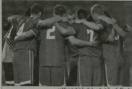
გივრატარნი საკრები ევროპაში გამოჩნდება

ტურინულ დერბოში "იუვენტუსის" "ტორინო" დაამარცხა, თუმცა ანტონიო კონტეს და მის გუნდს ურანოსიტების გვანამად შეუტყეს. ამოკონტრირებულ შთაბეჭდილებას დატოვა და თქმით არათუ ირჩეულა დაკავშირება "სიესა ნავიო, ერთ ინიზოში, მასაც შეიძლება ტურინო უნდა დაინიშნა. "გრანტას" სასარგებლოდ, მაგრამ დანილი, "იუვენტუსი" კიდევ უფრო უსამართლო გახდა მასპინძლის ტროფეუში. "იორიერ დელი სპორტი" ანტონიო კონტეს ატვალურ თემაზეც ვსაუბრობ.