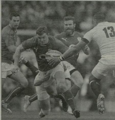
ბრიალი ოღრის კოლის ძალისხმევა ამაი გამოგვა