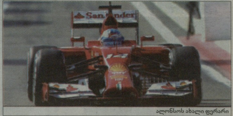
ალონსოს ახალი ფერარი

საერთო ცხრილის პირველ ხუთეულში ისევე ის პილოტები მოხდნენ, რომ