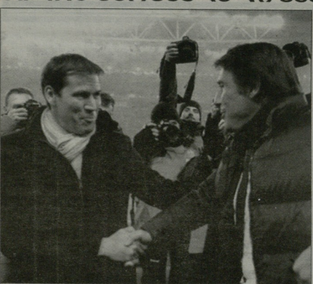
ანტონიო კონტე რეიდ გარისა შეპეი

ტურინულ დერბოში "იუვენტუსის" "ტორინო" დაამარცხა, თუმცა ანტონიო კონტეს და მის გუნდს ურანოსიტების გვანამად შეუტყეს. ამოკონტრირებულ შთაბეჭდილებას დატოვა და თქმით არათუ ირჩეულა დაკავშირება "სიესა ნავიო, ერთ ინიზოში, მასაც შეიძლება ტურინო უნდა დაინიშნა. "გრანტას" სასარგებლოდ, მაგრამ დანილი, "იუვენტუსი" კიდევ უფრო უსამართლო გახდა მასპინძლის ტროფეუში. "იორიერ დელი სპორტი" ანტონიო კონტეს ატვალურ თემაზეც ვსაუბრობ.