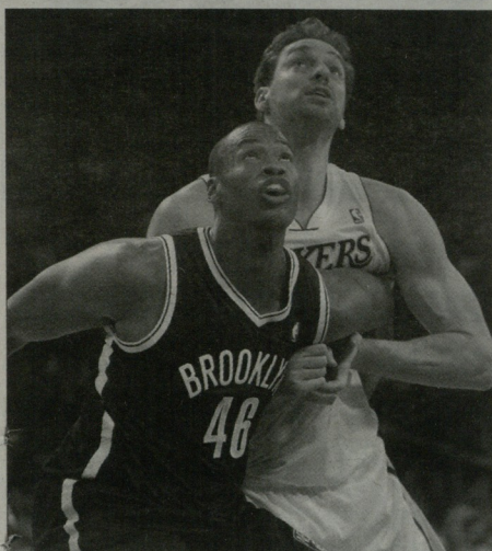
კოლინი გასოლის ნინაფლდე