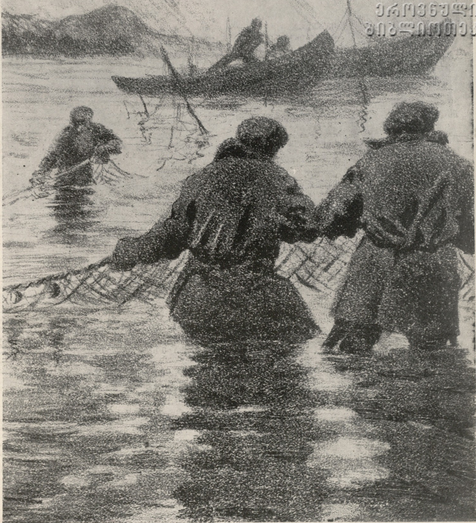
შ. თელია. მეთევზეები.