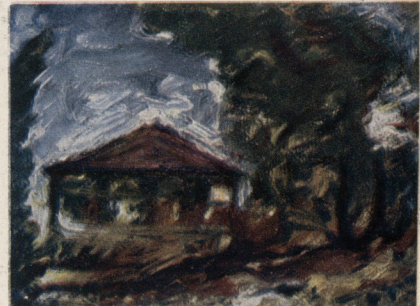
თბილისის სახელმწიფო უნივერსიტეტის სელოვანაის ფაკულტეტის სასწიითი სელოვანაის განყოფილების სტუდენტთა ნაგუაუპრები;