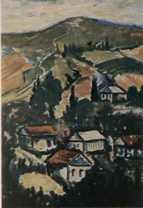
ი. გაბრიელა- შვილი (III კურსი). პეი- ზაჟი.