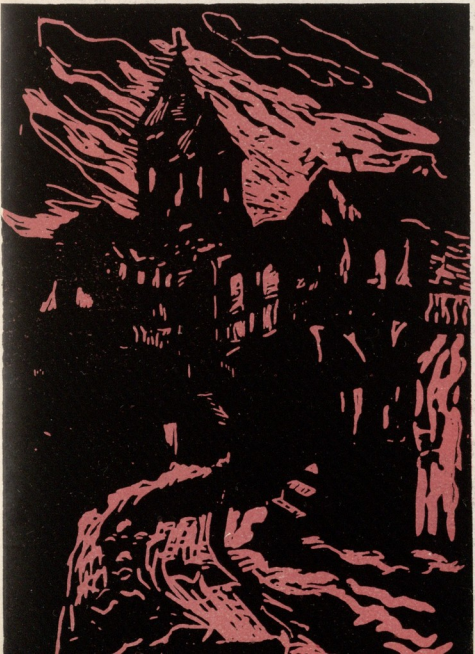
მ. ჭინჭიხაშვილი (III კურსი). ძველი თბილისი