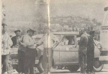
დაცავი წესი და უნატიონოდ კაცი მისა ვერ გრავრებს.