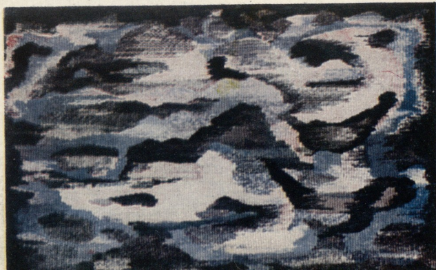
მ. სამაღუროვი. დეკორატიული ლაქები.