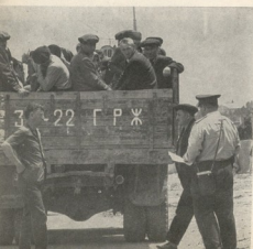
ეს ხანაჩი მანქანა ხელს სხვა სამუშაოზე იყო გავანაწილა შოი ფედას კი...