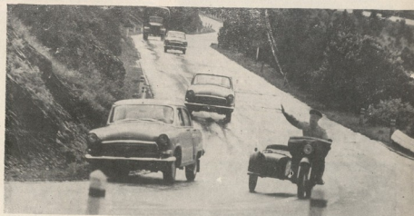
ამ კი ინსექტორი გარეზე და- შინდა.

ფოტორეპორტაჟი მოთა თერაპიისი და თარახან პარახანისი