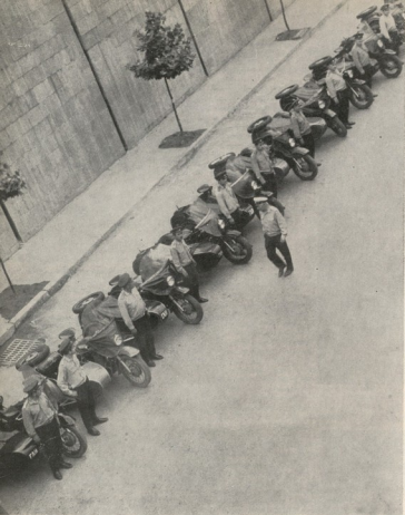
— ჩოქოს ავტონსაქცია ავტონსაქცირება შუად აზიან თავიანი პოსტებზე განაგრავრებულად