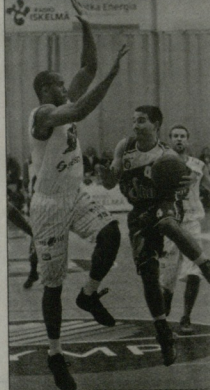
ნაკება. ლაუბელი მომდევნო შეხვედრას 19 მარტს "კუპალიკოს" წინააღმდეგ ჩატარდება.

"კორიკორატბმ" ვინანის ჩემპი-ონატი 35 მარტი აქვს ჩატარებული და 12 მარტის მთავი ადგა ზეა (სულ 12 გუნ-დე მონაწილეობს). პირველ პოზიციაზე სწორედ "პირინტო" - 32 გამარჯვება, 6