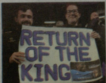
„მეფის დაბრუნება“ - ასე დაბედნენ დროგბას ჩელსის ფანები