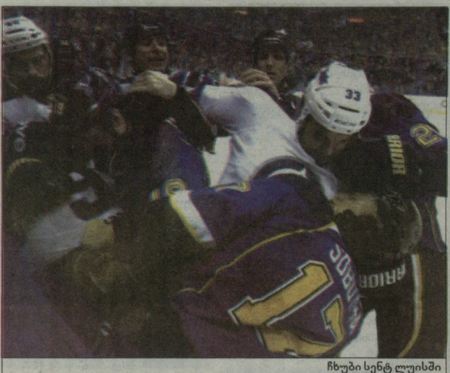
ჩხუბი სენტ ლუისში