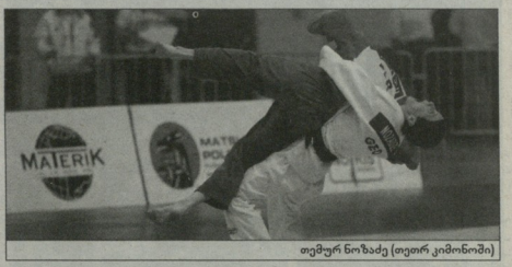
მურერ ნიშაქე (ფორმალური)