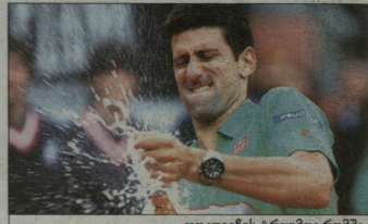
ჯოკოის ტრენინგი რომში