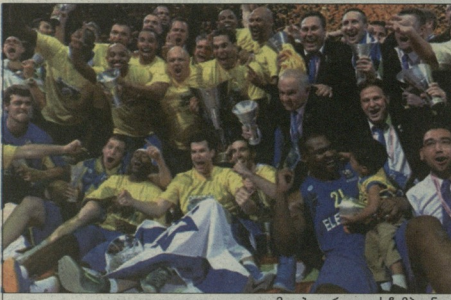
მაკაბი ევროლოის ჩემპიონი