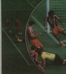
თამაში სამი მცველით (3-4-3) დაიწყო - ყველაზე უკან პოპტენი, მარტინესი და დანტე იდგნენ. მავარი, როცა „დორტმუნდი“ უბედურ, ბაიერლები თავს 5 მცველით იცავდნენ. თუმცა ნახევარი საათის შემდეგ, პეპი იძულებული გახდა, სტენა შეეცალა, რადგან ფულბი ლანი დაშავდა და მის ნაცვლად თამაშიში რიბერი ჩართო. მთავარი სიახლე კი, რო-

გერმანიის თასის ფინალი მწვრთნელების ტაქტიკური იმიოცი გამოიჩინა. გვარდილა გუნდს მთელი კვირის განმავლობაში დახურულ კარს მიღმა ავარჯიშებდა და შაბინის გავიცი, თუ რას უნდაღე და პეპი თავის დორტმუნდელი ვეზოს, იურგან კლუბს: „ბაიერნი“-