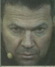
ნავა ლოტიან მათეუსი საბერძნეთში?