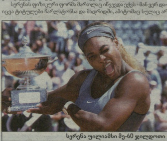
სერენა უოფილაში მე-60 ვიდლით