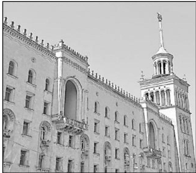
ვავით მეცნიერებათა აკადემიაში შექმნილ ვითარებაში დრამა ჩანს — გარკვევის მიზნით).

განათლებისა და მეცნიერების მინისტრმა თამარ სანიკიძემ ფაქტობრივად უარყო სამინისტროს მიმართ გამოთქმული საყვედურ-პრეტენზიები, - ჩვენი უწყება ყოველმხრივ ეხმარება მეცნიერებასა და მეცნიერებს, და თუ რამე პრობლემები მაინც არსებობს, სამინისტროს კარი ღიაა, მოხრძანდით, აი, მეცნიერებათა აკადემიის პრეზიდენტი, ბატონი ოთარ კვეციანიძე მოვიდა კიდეც ერთხელ ჩემთან (რთი, ბიძგეშვილი ქალბატონი, იქნებ ბატონო ოთარს დიდი მადლობა უნდა ჩათვალოს ის, რომ ინებებოდა მისი მიღება? ნუ მიწყენთ და, ჩემი ღრმა რწმენით, ნახევარი წლის განმავლობაში, რაც თქვენს მინისტრი ბრძანდებით, თუმცა ძალიან ბევრი საქმე და პრობლემა გაქვთ მოსაგვარებელ-გადასაჭრელი, უთუოდ უნდა გამოგნახათ დრო და, როგორც მეცნიერებათა მინისტრიც, თავად მიბრძანებული-