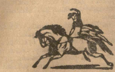
Циркъ Ж. Есиновскаго. Верійскій спектакль, соб. каменное зданіе. Тел. № 15—61.