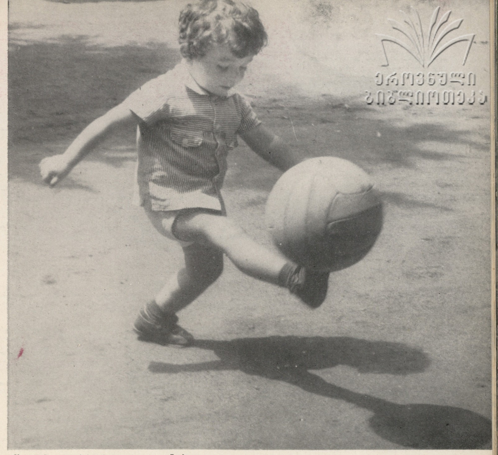
მზადება მსოფლიო ჩემაიოხატისათვის უკვე დაწყებულია