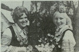
▶ ბავშვის ბავშვობის მისი მისი