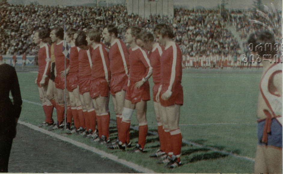
კაუკასუსის სპორტული საზოგადოების წევრები მსოფლიო საფეხბურთო ჩემპიონატის მსაჯურების სტრუქტურის წევრები მსოფლიო საფეხბურთო ჩემპიონატის მსაჯურების სტრუქტურის წევრები