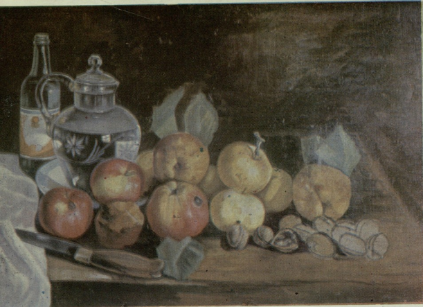
ჟივი შალვაინსკი (გორი)