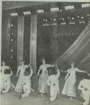
▶ ბავშვის ბავშვობის მისი მისი