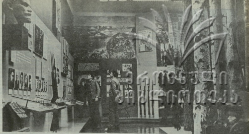
▶ ბავშვის ბავშვობის მისი მისი