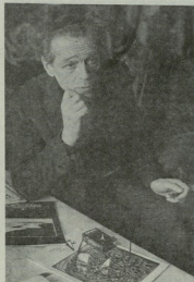
▶ ბავშვის ბავშვობის მისი მისი