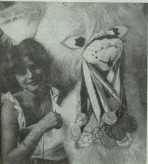
▶ ბავშვის ბავშვობის მისი მისი