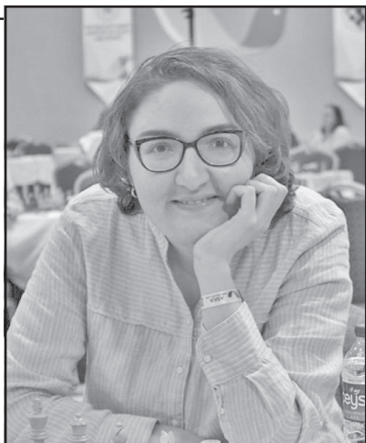
უკეთესი დამატებითი მაჩვენებლები ჩვენს ჩრდილოელ მეზობელს აღმოაჩნდა და ოქროს მედალიც მას გადაეცა.