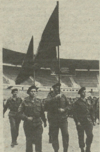
ცხოვრება მიეძღვრება საქმეს მოაბმარს.

ლოს რესპუბლიკის უზენაესი საბჭოს თავმჯდომარეს აკაკი ასათიანს, საქართველოს რესპუბლიკის მთავრობის თავმჯდომარეს თენგიზ სიგუას, რესპუბლიკის პარლამენტის წევრებს, მინისტრებს, სხვა ხელმძღვანელ მუშაკებს. პოლკოვნიკმა გიორგი პაპავაძემ პრეზიდენტს მოახსენა, რომ გვარდია მზად არის ფიცის მისაღებად. ბატონმა ზეიად გამსახურდიამ შემოიხილა მოკლე სიტყვით მიმართა. მან აღნიშნა, რომ გვარდიელობა საპატიო და ამავე დროს პასუხისმგებლობაა. ამიერიდან სამშობლოს, მისი დამოუკიდებლობისადმი ერთგულებამ უნდა განსაზღვროს იმათი ცხოვრების არსი, ვინც გადაწყვიტა