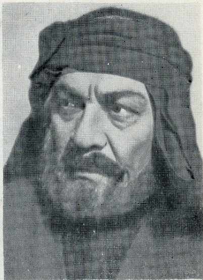
გელა — ი. ტრიპოლსკი „შოდღარი“