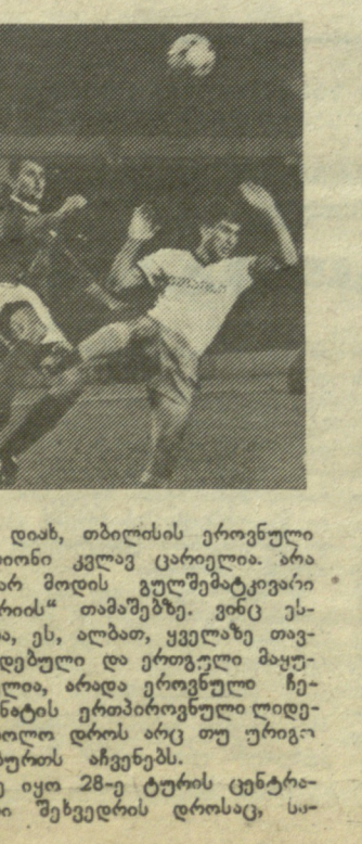
... დაახ. თბილისის ეროვნული სტადიონი კვლავ ცარიელია. არა და არ მოდის გულშემატკივარი „იბერიის“ თამაშებზე.