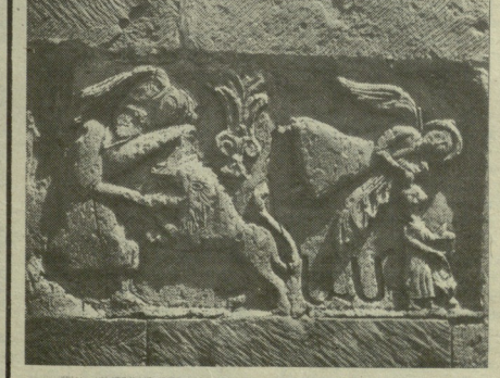
ზურბა მამარღმევის ფიცი. (სამონუმენტო)