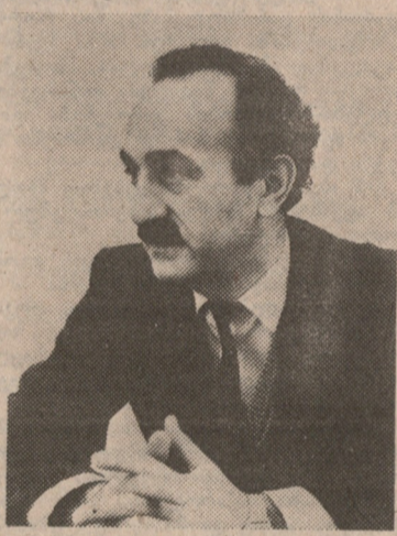
ბატონ ტარიელ გელანტასი კი მიანა: ეკონომიკური დაქვეითების პროცესის შეჩერება შეუძლებელია...