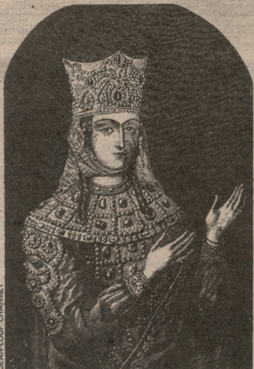
La reine Thamar. Gravure de P. Fritel (XIX e siècle) d'après un tableau du XII e siècle.

La lé dissoci Rousta: reine, a son fan léopard littérati séde ui cœur d' d'un tit héroïqu l'amour sion le: société serait à Les i mirent ; Consta Géorgie l'enjeu d'être a L'hor drainer Radio-F pour ai aspirati pendant