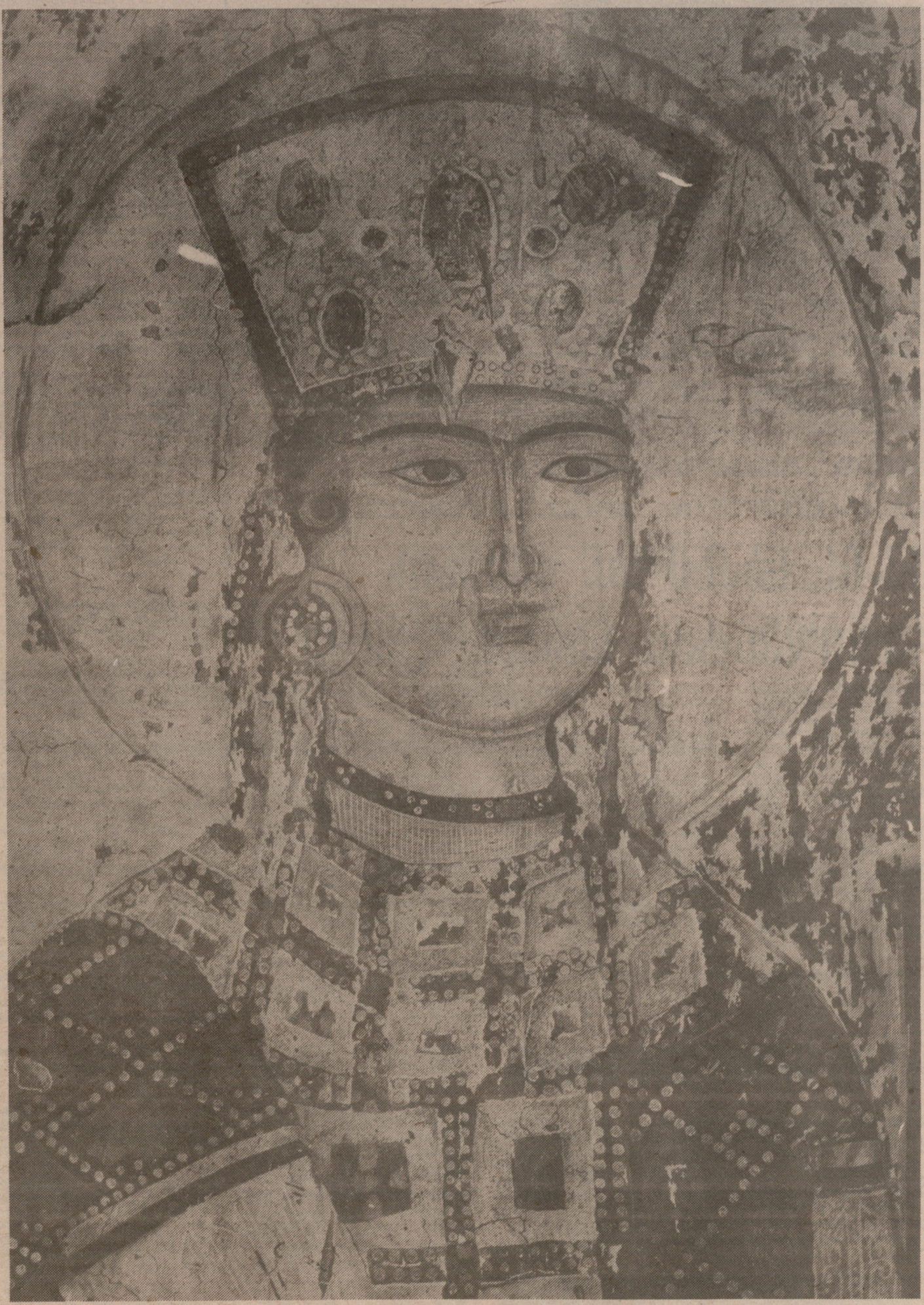
ისტორიანი და აზმანი შარავანდედთანი.

ვარ შიტიყუა იგი საშუაგელმან ამის საწუთროსამან, არცა მეფოგამან გვირგვინისამან და სკიპტრამან, არცა ქვათა პატიოსანთა უსუად ქონებამან, არცა სპათა სიმრავლემან და ესოდან სიმხნემან, რომელი სიტყუამან ცხადყოს. არა მიდრეკა, ვარცა წარიპარა სიმდიდრემან, ვითარ კაულ-ოდსგე მეფენი მრავალნი და უმეტეს ამის სანატრალისა მამა, ყოველთა ზრკანთა უპირატესი და უმეტესი სოლომონ. ესრე უზრკანე იქმნა ზრკანისა მის, რომელ ესოდან შიყუარა ღმერთი იგი და უცხო ექმნა საცთურთა სოფლისათა. ამან ისმინა ხმა იგი უტყუელისა პირისა და შიტიკპო იგი, რამეთუ ღამეყოველ მძღვიპარება, ლოცვა, მუსლთ-დრეკა და ცრემლით ვედრება ღმერთისა ზემდგომრობითა განსაკვირვებელი აქუნდა, და ღამე ყო ხელსაქმარი, რომელი გლახაკთა მიეცემოდა. ერთი ოდენ ვახსენოთ.