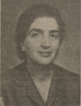
რას დამახარებთ-მეთქი? მიხატეს: კითხვ, როგორი მამა თვითონო.

— მიგანჩიოთ თუ არა, რომ დედა გადამწყვეტ როლს ასრულებს შვილის სულიერი ჩამოყალიბების საქმეში? — ნამდვილად. უდიდესი როლი აქვს მამასთან ერთად და ჩვენი დედები, რასაკვირველია, უნდა დაუფიქრდნენ ამას... შვილის აღზრდა, სკოლით და გარეშე პედაგოგებით კი არა, უწინარეს ყოვლისა ოჯახით წარიმართება, ოჯახია გადამწყვეტი... — ბატონო ზვიად, თქვენთან რომ მოვიდიოდი, ჩემს შვილებს ვკითხვ