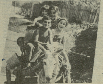
1 ივნისს საქართველოს ბავშვთა დღედ გამოცხადდა. აღინიშნებას საქართველოს ბავშვთა დღის დღი. იმისთვის, რომელიც საქართველოს ბავშვთა დღის დღი. იმისთვის, რომელიც საქართველოს ბავშვთა დღის დღი.