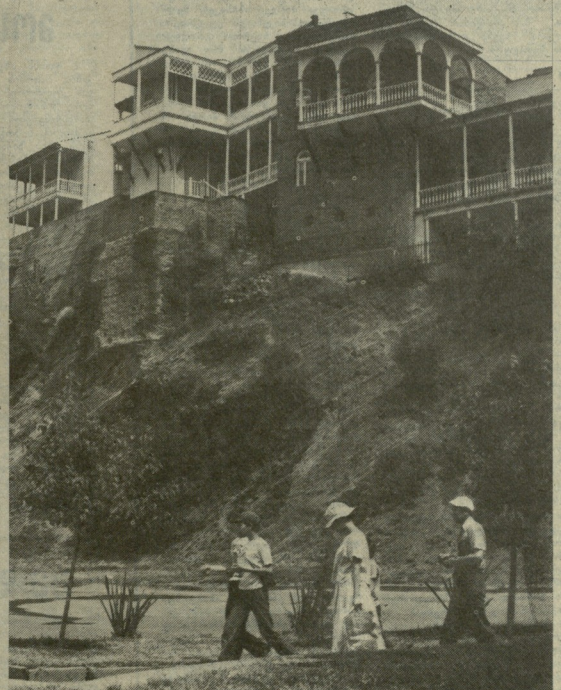
საგო თვაჯაის ფოტოში.