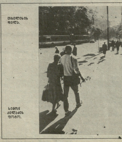
თხილის დილა. კორნის კარქის ფირმი.