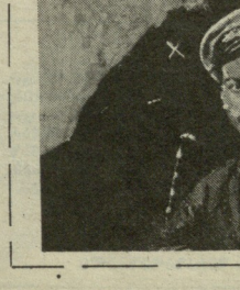
აი, ასე უსამართლოდ დაღუპა ვეცის სამხარეო შვილი, ამოქრულცი...