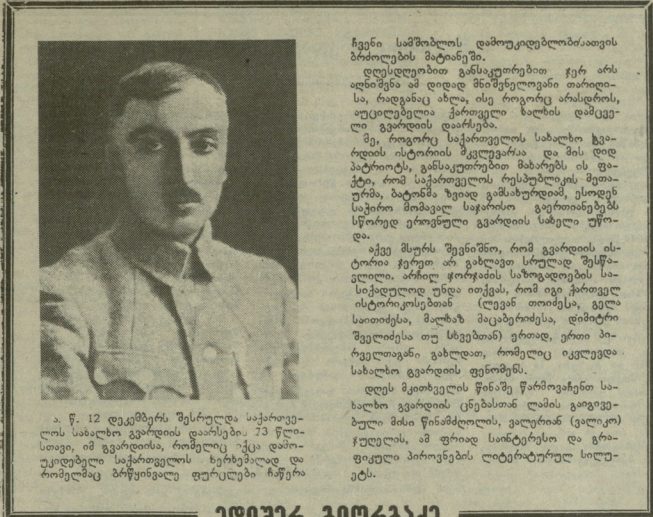
ა. წ. 12 დეკემბერს შესრულებული საპროექტო სახალხო გავრცელების დასკვნა. 73 წლისაა, იმ გვარისა, რომელიც უკვე დამოუკიდებელი საქართველოს ხელშეწყობა და რომელიც ბრძოლისთვის ფერადი ჩრეტი