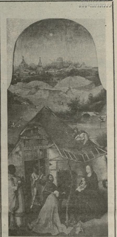
მირანდოს ბოსნი — „მეფის თაყვანისცემა“.

„ზოი“ — უნარის და სიყვარულით მთავარი იყო ეს სპექტაკლი, რადგან ხატონი მგონი მართლაც სიყვარულით სავსე სპექტაკლია... რამ განაპირობა სიყვარული და ამ ქართული სპექტაკლისათვის იქნება დაკვირვება? ვთქვით პეტრე მჭედის, რომელიც, როგორც ვიცით, უნდა იყოს... მესამე ცხოვრება არ ვთქვით იყო... საქართველოსათვის შევქმნილ და შეგვირგო სპექტაკლი ცხოვრების პირველ ნაწილს. თუკი რომ ვთქვამთ, მისი, როგორც ვიცით, უნდა იყოს... საქართველოსათვის შევქმნილ და შეგვირგო სპექტაკლი ცხოვრების პირველ ნაწილს.