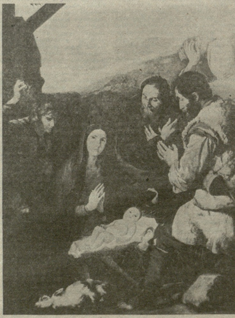
„მწიანს მწველ მწავდე...“

სიყვარული ქართველების სენია, სენი გრის სცენიური დრამის, „სიყვარულის გარდა რა დაგვრჩენია...“