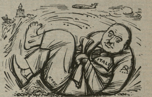
ალფანემა-მავანეილიზი, ანუ ალარ მიუზნისა... მითრებულ შარეი უმ. მიხინოვნილისა.

P. S. ზემოთაღნიშნული პუბლიკაციის შემდეგ საეკვი ადარაფერი ჩანს, მაგრამ საქართველოს კომპარტიის ცეს ხელმძღვანელობა უფრო გულანამით ხომ არ განახედავდა გაზეთ „ცხოვრების“ ნომერს, რომელშიც ასე შეკოფთვნი გამოჩნდა მისი რედაქტორის პაბიტუსი და ხომ არ გამოყოფდა სპეციალურ კომისიას ბატონი ლოდის სულიერი მღვდამარობის შესასწავლად? ვფიქრობთ, ეს ყოველმხრივ სასარგებლო საქმე იქნებოდა. ყოველივე ამას სრულ სერიოზულობით ვაცხადებთ.