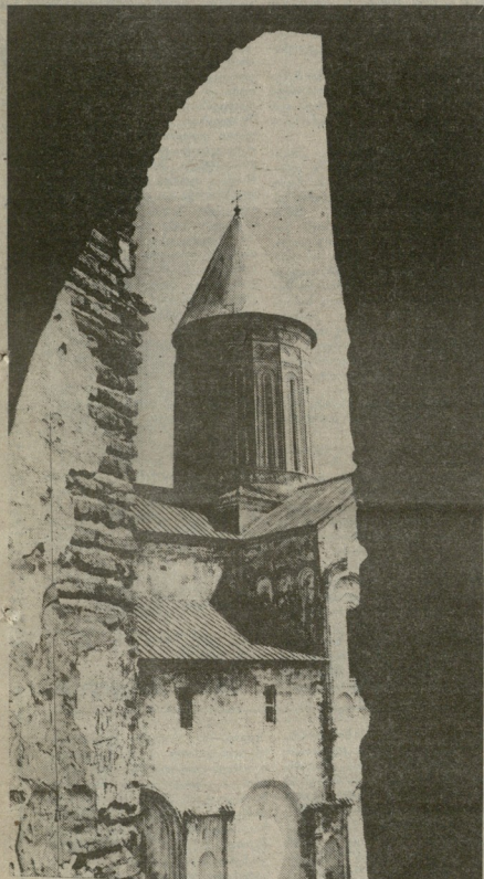
ალავერდი და წაღრუღაშენი. ჭარბა ღმთაუფილის ფოტოგრაფი