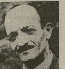
და მ. მარტო მიტოვდება მე მუხეზ: არა ქაჯაძის“.