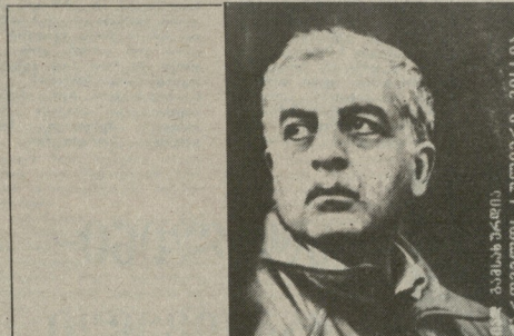
საქართველოს უსივრცო უსივრცო მისია