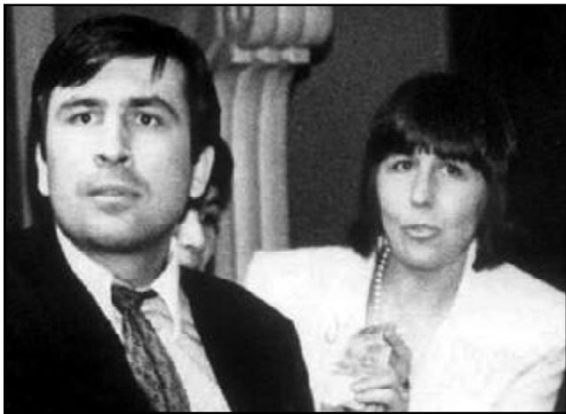
მის გამოძიებაში, — აცხადებს ჯონდი ბალათურია და განმარტავს, რომ სააკაშვილი ახლა ხაფანგშია, თუნდაც ამ საქმიდან გამომდინარე...