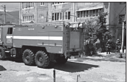
მოგვიანებით მომხდარზე საგანგებო სიტუაციების მართვის სამსახურმა განცხადება გაავრცელა. „შინაგან საქმეთა სამინისტროს გადაუ-

დაკვამლიანების გამო საავადმყოფოში გადაიყვანეს, – უთხრეს მეზობლებმა „ქართლს“.