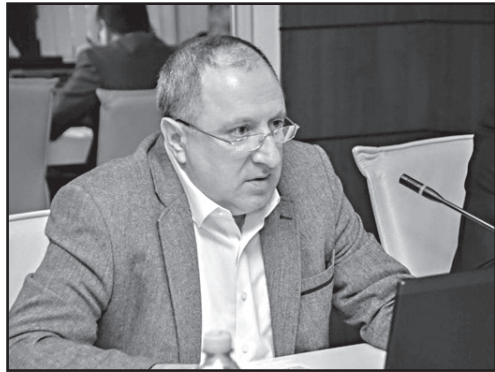
ვილს უნდა განემარტა, წინააღმდეგ შემთხვევაში, მიიჩნევეს, რომ ეს არის ინტერესთა კონფლიქტი.

გუშინ, 9 ივლისს, იუსტიციის უმაღლესი საბჭოს მოსამართლე ნევირ სერგო მეტოფიზიკის საბჭოს არამოსამართლე ნევირს ინტერესთა კონფლიქტსა და ორმაგ სტანდარტში აღანაშაულებს.