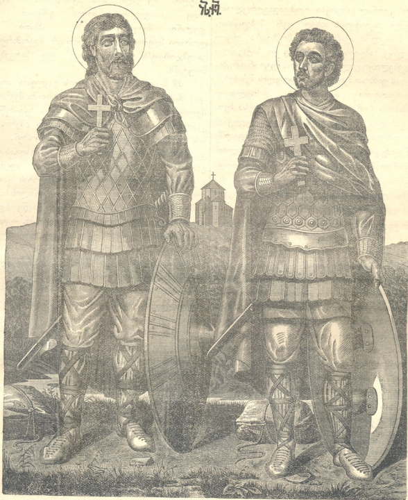
წმიდა მოწამენი დავით და კონსტანტინე. *)