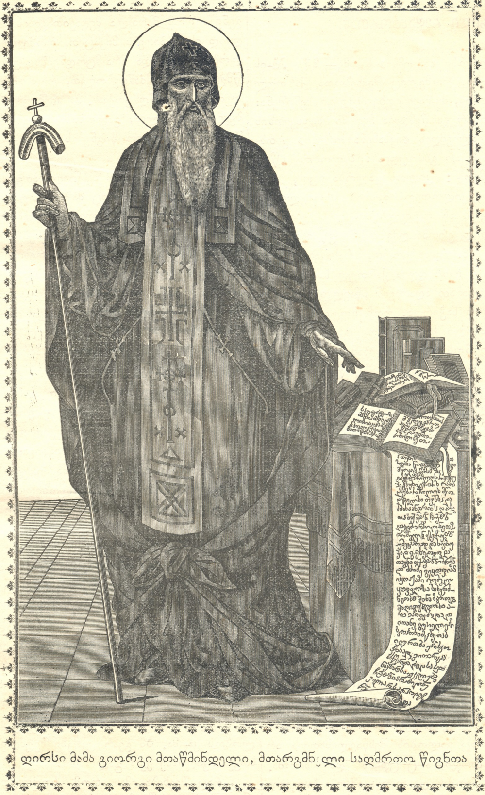
ამ წმიდანის ცხოვრების აღწერა იქმნება შემდეგ ნომერებში.