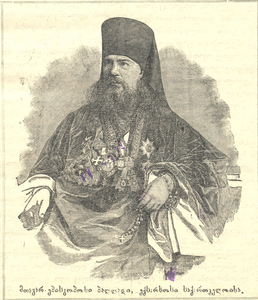
მთავარ-ეპისკოპოსი მხლადი, ექსარხოსი საქართველოსა.

მალაქის მართლმადიდებელმა სამღვდლოებმა აღრიხანდ სწირა თავიანთ ეკლესიებში და გადინადა სამადლობელი პარაკლისი. შოველ ეკლესიაში მლოცველები ბლომად დაესწრენ წირვას. როგორც სამღვდელოება, ისე მლოცველები გულმოდგინებით ევედრებოდნენ ღმერთსა და