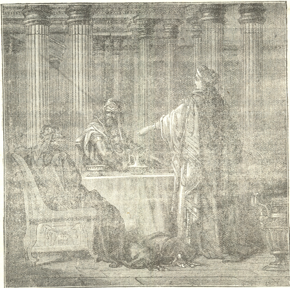
— «მს მოახთინა ჩვენმა მტერმა — ამ ბოროტმა ანამა!» მიუგო დედოფალმა. ეს რომ გაიგონა ამან — მა, მას შიშის თავზარი დაეცა. — მხოლოდ ახლა მიხვდა, მას შიშის თავზარი დაეცა. — მხოლოდ ახლა მიხვდა, რომ ესთერი იყო ებრაელი. ამაზედ მეფე

შინ გაბედა ამ საქმის ჩადენა? მრისხანედ იკითხა მეფემ.