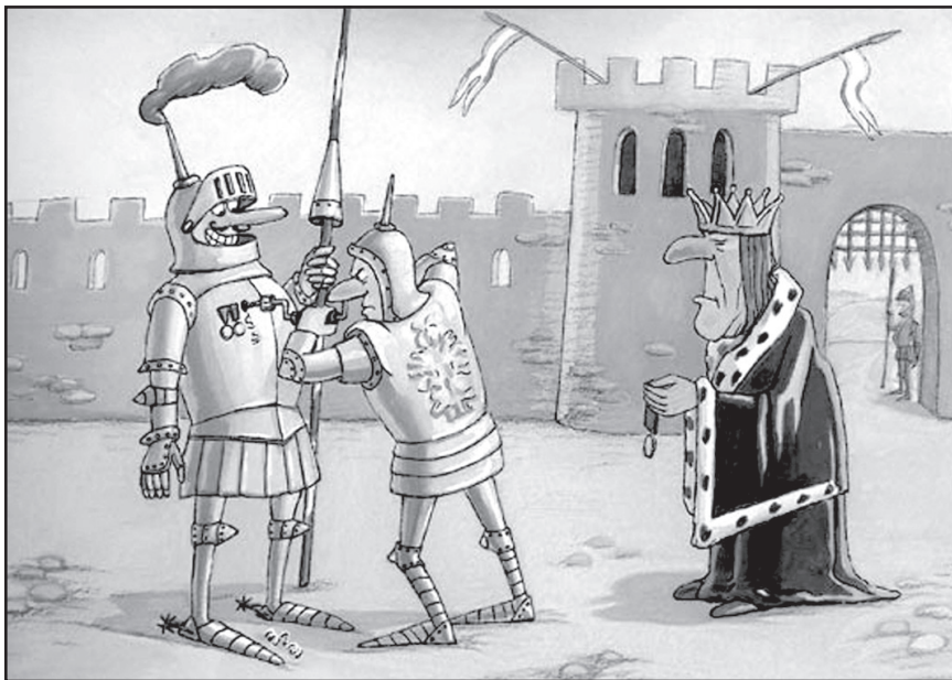
რატომ უნდა დავოიპრადო, სანამ ვიოიპრადო?..

ფირანის აქილევსის ქუსლი, როგოც წესი, ჩექმაშია დამალული.