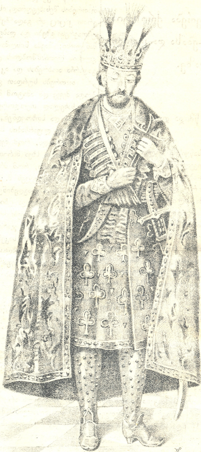
საქართველოს მეფე წმიდა ლუარსაბი.

Handwritten Georgian text in the left and right margins, likely bleed-through from the reverse side of the page. The text is written in a cursive script and is mostly illegible due to fading and bleed-through.