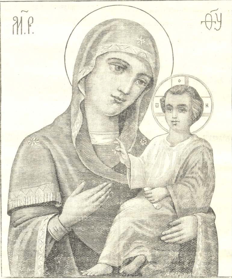
სახე იმ ლეთისმშობლის ხატისა, რომელიც სპარსელებმა წაიღეს მცხეთიდან.

ხატის სახე დაათვალიერა, ნახა, რომ ეს სასწაულთ- მოქმედი საქმეველს ხატი ძველი დროის მხატვრობა იყო. დასატულია თითბრის განაყით სქელს მუხის ფიგურაზე, შუაზე ამოჭრილია, ნაზირები გამოწეული აქვს; ქვემო ბოლოს შუაზე წინა ზირზე ამოტკრეულია ის ნაწილი, რომელზედაც გამოხატულია ფეხი შემდგომისა. ზემოთ წაწერილებულია, თვითონ ფიგურა განე- თქილია თავამდე უჩრდონო სპარსელებისაგან, რომელთაც