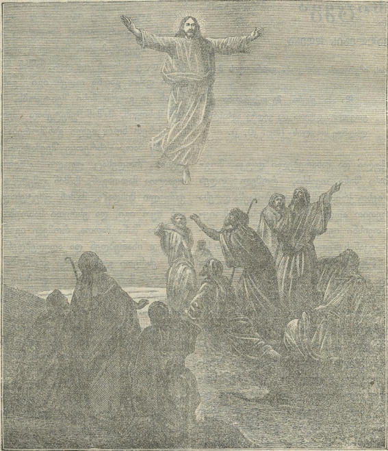
ამაღლება უფლისა ჩვენისა იესო ქრისტესი.

რა სახით უნდა შევიდეს უფალი იესო ქრისტე შენს გულში, როდესაც იგი არის აღსვებული ყოვლითა ამოკებითა ო ადგილი აღარ არის თავისუფალი, რომ განისვენოს მუნ უფალმან. ამისთვის, ძმაო, თუ გსურს, რომ უფალი იყოს შენთანა, ხშირად უნდა ფიქრობდე მას ზედა, ხშირად უნდა წარმოიდგენდე ღვთაებრივსა მისსა ხატსა. ყოველთა ღვთის მოყვა-