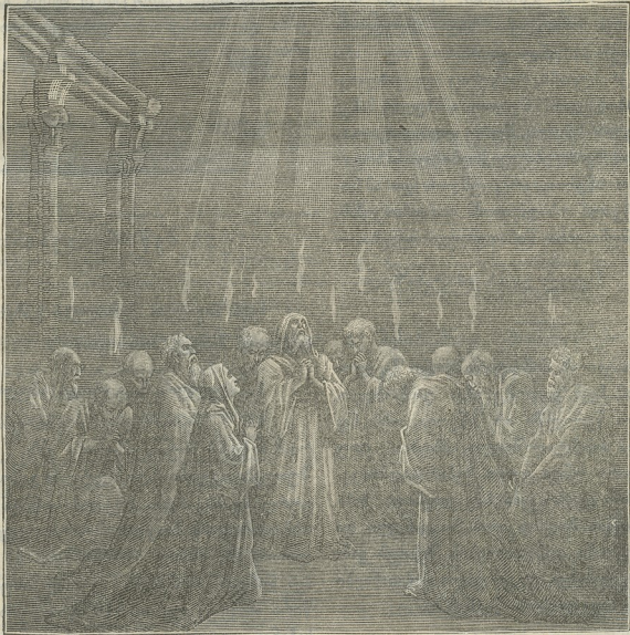
სული წმიდის გარდამოსვლა მოციქულებზე.

ნი, განდრეკილნი და ქრისტეს წინააღმდეგნი რომ წაიკითხვენ, იძულებულნი უნებლიედ აღიარებენ, რომელ იგი სწორედ არის სიტყვა ღვთისა და არა კაცისა, და თუ ესრეთი მოქმედება აქვს სახარებას გულთა ზედა თვით ურწმუნოთა კაცთასა, წარმოიდგინე რა მადლი და სარგებლობა მიეცემა კაცსა, რომელი სარწმუნოებითა და სასოებითა იწყებს კითხვასა მისსა. ამისთვის თუ გსურს, მშაო ჩემო, რომ სული ქრისტესი მივახლოს სულსა შენსა, ხშირად წაკითხავდე სახარებასა ქრისტესსა. მაშინ შეიტყობ, რომ უტყუელ არს აღთქმა მისი: „აჲ ესერა მე თქვენთანა ვარ ყოველთა დღეთა.“ ამინ“.