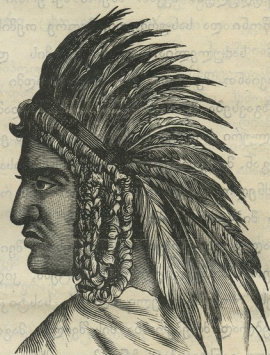
ყვავის მზავისი ინდოელი