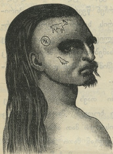
მცხოვრები სანდიჩვის კუნძულისა.

შეიძლება, ისინი არც კი იღვინენ მიიბუნებზე წინ, უნებლიედ ადარებენ კაცს ცხოველებს, თუმცა ცხოველებსა და კაცს შორის ძლიერი განსხვავება არის და სახელდობრ ის, რომ ცხოველი მარტო აწმყოზე ზრუნავს, კაცი კი მუდამ ფიქრობს მომავალზე, რომელსაც შეჰყურებს ხან იმედით და სიხარულით, ხან სრული რწმენით და სიყვარულით და ხან ძრწოლით და შიშით. რამდენათაც კაცი ბრიყვი და გაუნათლებელია, იმდენათ მას ურიგო