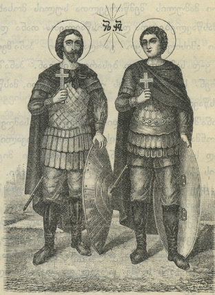
წმიდანი მთავარ-მოწამენი ღვით და ქონსტანტინე.

ორს ოკტომბერს ჩვეულებრივად იღდესასწაულეს „მოწამეთობა“ მოწამეთის მონასტერში. მატარებელი შედ-რვაჯერ მივიდა გელათში და მობრუნდა ქუთაისში, მაგრამ ყოველ წასვლა-წამოსვლაზე ვაგონები მაინც ვერ იტყვედნ ხალხს: ამიღი კარგი იყო და ამისათვის ნამეტანვად ბევრი ხალხი მიაწყდა მონასტერს. პირველ ოკტომბერს, საღამოს მონასტერში მობრძანდა ყოვლად სამღვდლო ბესარიონი კრებულისათვის და საღამოით გარდაიხადეს დიდი მწუხრი. ცისკარი დაიწყეს ნაშუალამევის სამ საათზედ და გათენებისას გათავდა. ორს ოკტომბერს წირვა დაიწყო დილის ათი საათის ნახევარზე და პირველი საათის გასრულებამდისინ ვაგრძელდა წირვა და პარაკლისი. ყოვლად სამღვდლოს ბესარიონთან მწირველი ბრძანდებოდნენ მონასტრის წინამძღვარი არხიმანდრიტი ბესარიონი, გელათის მონასტრის წი-