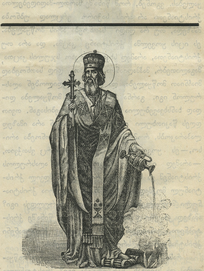
მღვდ.-მოწ. აბიბოს ნეკრესის ეპისკოპოსი (ხსენება მისი 29 ნოემბერს).

იქ ავაზაკებისაგან. წინედ მის მოსვლისა, იქ გაიარეს მღვდელმა და ლევიტელმა, გარნა, შიშისაგან, ვერ გაჰხედეს იქ გაჩერება და შემწეობის მიცემა დაჭრილისათვის. სამარტელმა არ მიჰხედა ამას ყოველსა, არ იფიქრა მან, რომ ავაზაკები, რომელთაც დასჭრეს კაცი იგი, მახლობლად იქმნებოდნენ და მოჰკლავდნენ მას, არამედ გამოიმეტა თავი და მისცა შემწეობა უბედურსა მას დაჭრილსა. ესრეთი თავის გამომეტება მოწყალეობის აღსრულებაზე, არის ნამდვილი ქრისტიანული მოწყალეობა, უმაღლესი სათნოება. როდესაც კაცი, არა თუ თავისი ქონების და ნაყოფისაგან ეწვევა გაჭირვებულს კაცს, არამედ თვით სიცოცხლესაც აღარ ჰზოგავს მოყვასის გულისათვის, იგი აღსრულებს ჭეშმარიტად მცნებასა ქრისტიანულისა სიყვარულისასა; იგი ჰზადავს თვით მაცხოვარსა, რომელმან თავი თავისი შესწირა ღმერთსა სახსრად ჩვენდა. ამინ.