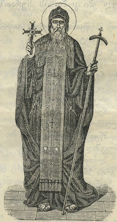
საკვირველთ-მომქმედი ილარიონ ქართველი. (ხსენება მისი 19 ნოემბერს).

11 ნოემბერს სოფ. ალისუბანში გაიხსნა მეორე კლასიანი სასწავლებელი. სკოლა გახსნა იმერეთის ეპარქიის მეთვალყურემ მღვ. მელიტონ კელენჯერიძემ შორაპნის სასწ. რჩევის განყოფილების წევრის ბლად. ივლიანე აბესაძის თანადასწრებით.