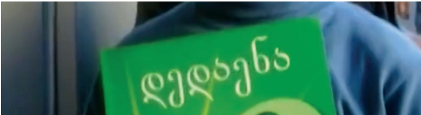
„ჩვენში არასდროს ჩაკვდება ქართული სული“ – მოსწავლე ოკუპირებული გალიდან. ვიდეო-კადრი სიუჟეტიდან

2018–2019 სასწავლო წელს გალის „ქვედა ზონის“ სკოლების I–VII კლასები მთლიანად რუსულენოვანი გახდა. ამ კლასებში ქართული ენა ისწავლება, როგორც უცხო ენა – კვირაში – 1 საათი, ლიტერატურა – 2 საათი. ყველა დანარჩენ საგანს მოსწავლეები რუსეთის ფედერაციის სახელმძღვანელოებით ეუფლებიან.