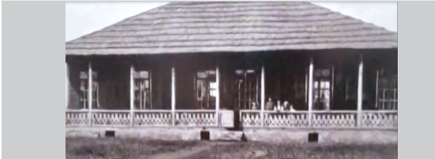
ქართული სკოლა XIX საუკუნის სამურზაყანოში. ვიდეო-კადრი სიუჟეტიდან

ავტორები: მართა კასრაძე, სოფო ნულაია, ნონა შონია