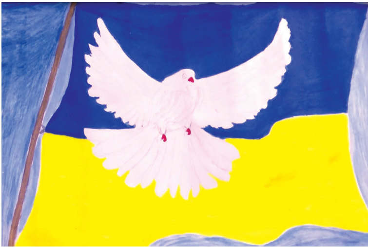
კონფერენციაზე წარმოდგენილი დევილ ბავშვთა ნახატების გამოფენიდან

გარდა ამისა, ჟურნალისტს უნდა ახსოვდეს, რომ რასაც ის აშუქებს, ყოველთვის ახდენს გავლენას არა მხოლოდ კონფლიქტის მსვლელობაზე, არამედ, ადამიანთა ცხოვრებაზეც. ჟურნალისტი უნდა იყოს ფხიზლად, რათა არ მოხდეს მისი ბოროტად გამოყენება ერთი, ან მეორე მხარის მიერ ომის, ან ძალადობის წასაქეზებლად. მსგავსი შემთხვევის არსებობისას უნდა მოხდეს მისი გამოაშკარავება, როგორც მედიით მანიპულირების მცდელობა.