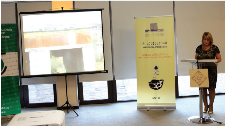
როცა მოხსენება საინტერესოა