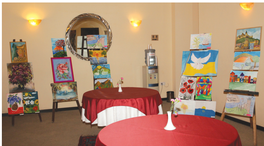
აფხაზეთიდან დევნილი ბავშვების ნახატების გამოფენა სასტუმრო „ბეტის“ ფოიეში