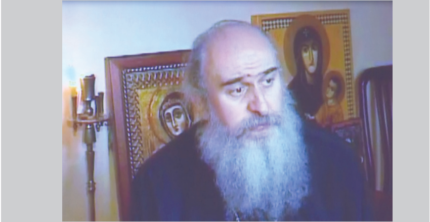
მეუფე დანიელი (დოკუმენტური ფილმი „კომანი“)

ავტორები: მართა კასრაძე, კობა ბროლიაშვილი, რევაზ ახვლედიანი