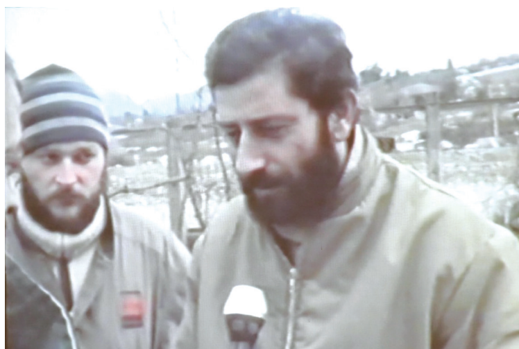
აფხაზი ჟურნალისტი: „ჩვენ გვინდა აღდგეს მშვიდობა და ვიცხოვროთ ისე, როგორც ადრე ვცხოვრობდით... გვინდა, ყველაფერი ადრინდელივით იყოს“