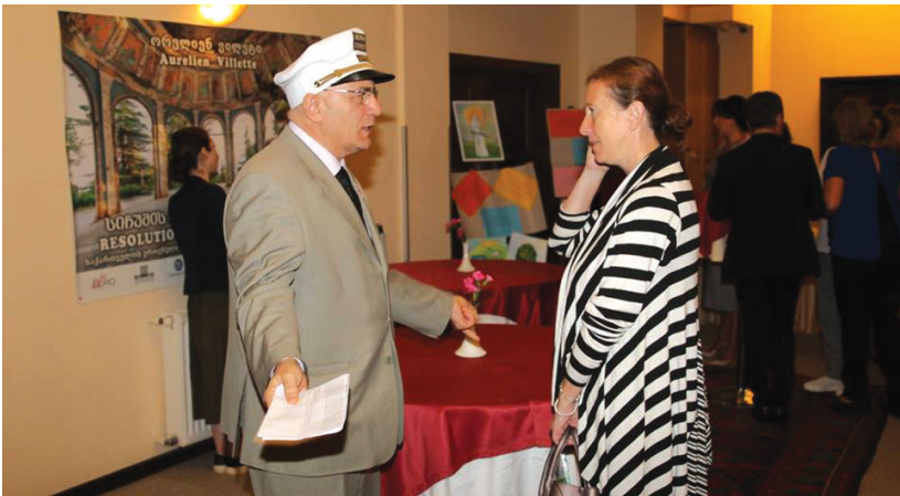
საუბრები და დებატები შესვენების საათებში

გავიდა 25 წელი 1993 წლის სექტემბრის ტრაგედიის შემდეგ, მიუხედავად რთული გეოპოლიტიკური სიტუაციისა, მჯერა, საქართველო აუცილებლად გაერთიანდება მშვიდობიანი გზით. ამის რეალური შანსები იყო და არის. საქართველოს გაერთიანების პროცესში დიდი წვლილის შეტანა შეუძლიათ ჟურნალისტებს და ყველა იმ ადამიანს, ვინც სხვადასხვა ფორმით და დობით ჩართულია მედიაში.