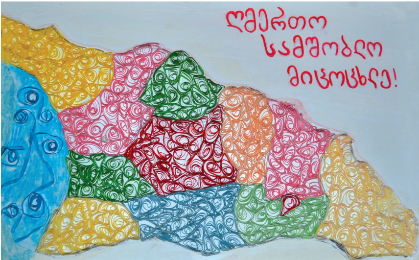
კონფერენციაზე წარმოდგენილი დევილ ბავშვთა ნახატების გამოფენიდან