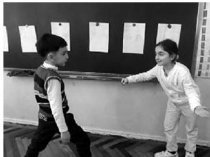
„სტუმრის სახლში შემატივება“

დაიწყო დისკუსია პერსონაჟების, მოვლენების, გარემოებებისა და მოქმედებების შესახებ, რომლებიც ნაწარმოებს უკავშირდება.შეჯამების სახით, წარმართე რეფლექსია შესრულებულ სამუშაოზე. მოსწავლეებმა იმსჯელეს ისეთი შეკითხვების გარშემო, როგორცაა: რა გავაკეთეთ? რა გამოვივიდა კარგად? თავიდან რომ დავგვედგა, რას შევცვლიდით? როგორ დავგვეხმარა მეთოდი საკითხის გაგებასა და ათვისებაში?