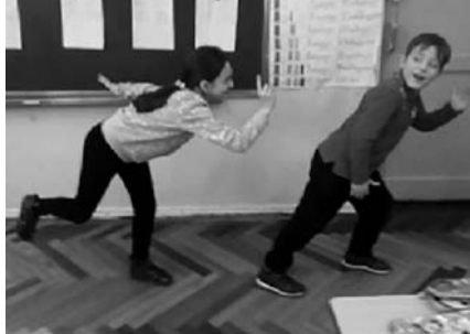
„ტყუილს მოკლე ფეხები აქვს“