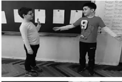
„ფიცი მწამს - ბოლო მაკვირვებს“