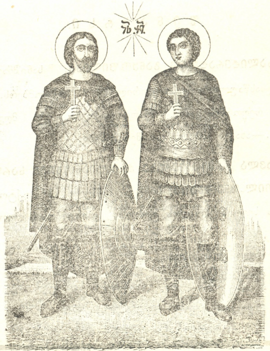
წმიდანი მთავარ-მოწამენი ანტოკუთის მთავარნი დავით და კანსტანტინე.