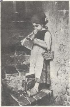
---ვერ მოვასწარი გაკვეთილის სწავლა. სურათი კაუღლასხისა.