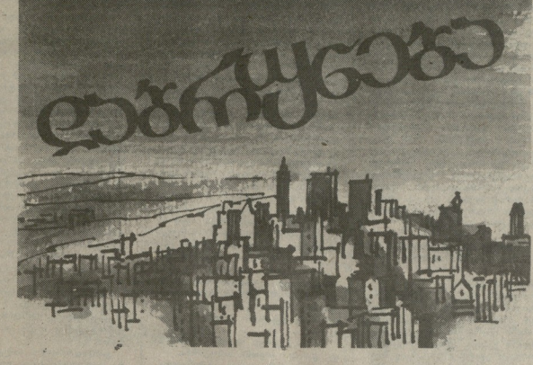
მთიანეთის რაიონის სოფლები