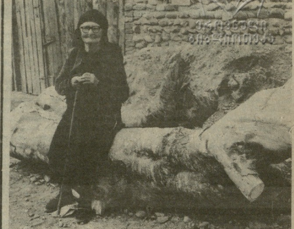
მთლიანად, უნახავო მდგომარეობაში მყოფი...