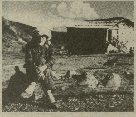
პერიკაქვი, ზურაბ დამთავზილის ფოტობი.

● საქართველოს მერაბიო კავშირი და ვაგევი „ლიტერატურული საქართველოს“ რედქციულეცეიან მერაბლ მამია ახათიანის შეუღლეს სოფურ ახათიანის ვარადეულებს და თანარბინობას უღვაწედენ წანხურბელის თახას.