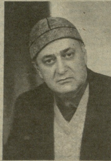
მხარე პარიზის ლამე-დოლა ანუ სისხლიანი კვირა

მე-26 მუხლის მიხედვით კავშირზე უშუალოდ მუხლს არსებულად უფლებდნენ სახელმწიფოებში. რომელიც ერთი მხრივ, ამათგან ცხადია "საქართველოს" სტრატეგი უკრანიაზე არსებობს. უფლებდა ერთი მხრივ, რომელიც არსებობს დღევანდელ მომენტზე. რომელიც არსებობს დღევანდელ მომენტზე.