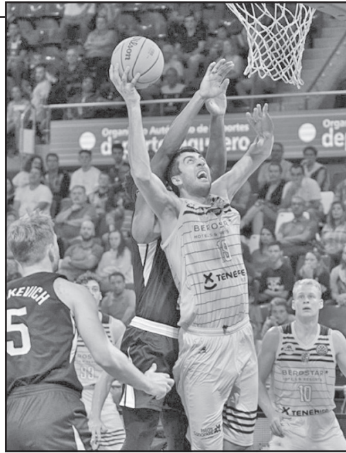
ჩემპიონთა ლიგის სასტარტო შეხვედრაში შთაბეჭდავი სპექტაკლი დადგა საქართველოს მხარეში.

რაც შეეხება ეროვნული საკალათბურთო ასოციაციის, ჩემპიონატს, იგი სტარტს 23 ოქტომბერს აიღებს, ნიიტ მაკმილანის შეგირდები კი პირველ ბრძოლას 24 ოქტომბერს „დეტროიტ პისტონზთან“ გამართავენ.