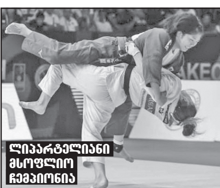
ლიპარბაიანი მსოფლიო ჩემპიონი