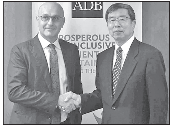
გაფართოება-გავრცელება განათლების, პროფესიული განვითარებისა და საჯარო მმართველობის მიმართულებით.

რეებმა მიმოიხილეს საქართველოსთან 2019-2023 წლების სტრატეგიით გათვალისწინებული პრიორიტეტული მიმართულებები, რომლის მიზანია რეგიონული კავშირების გაღრმავება, კერძო სექტორის განვითარება, ურბანული განვითარების მხარდასაჭერად სატრანსპორტო ინფრასტრუქტურის გაძლიერება, აზიის განვითარების ბანკის [ADB] როლის