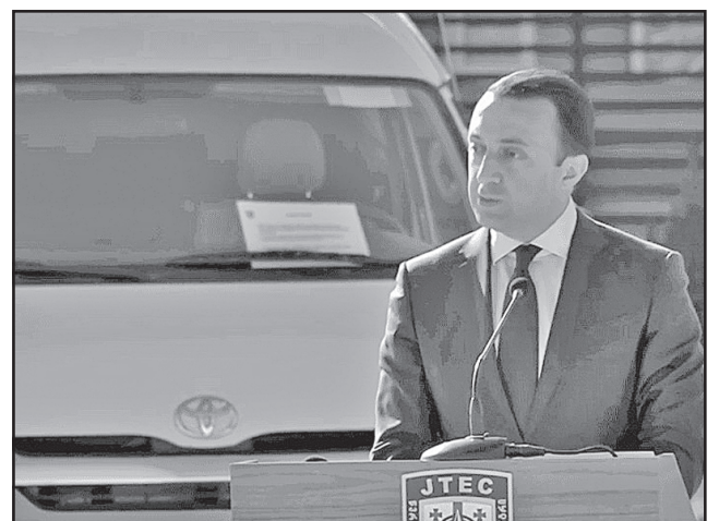
თი დღე აახლოებს თქვენს ქვეყანას ნატოში განვითარების მიზანთან“, — აღნიშნა ნატოს სამეკავშირეო ოფისის ხელმძღვანელმა. ნორვეგიის სამეფოს საგანგებო და სრულუფლებიანი ელჩის საქართველოში ჰელენა სანდ ანდრესენის თქმით, საქართველოსთვის ავტორიზაციის გადმოცემა ნატოს მხრიდან ცენტრის მიმართ ალბულო ვალდებულებების კიდევ ერთი დასტურია.

სამუშაო პირობების გაუმჯობესებას. პროექტი დაინიშნა სამეფოს, გერმანიის, იტალიის, ლიეტუვას, ნორვეგიის, პორტუგალიის, თურქეთისა და გაერთიანებული სამეფოს დაფინანსებით და ნატოს უზრუნველყოფისა და შესყიდვების სააგენტოს მხარდაჭერით განხორციელდა. თავდაცვის მინისტრმა ნატო-საქართველოს არსებითი პაკეტის წარმატებასა და მისი განვითარების სამომავლო გეგმებზეც ისაუბრა. განსაკუთრებული ყურადღება გამახვილდა JTEC-ის მნიშვნელობასა და მისი განვითარების პერსპექტივაზე. საქართველოში ნატოს სამეკავშირეო ოფისის ხელმძღვანელის როზარია პუგლისის განცხადებით, JTEC არის წარმატების მაგალითი და ნატო-საქართველოს თანამშრომლობის ხელშეწყობის შედეგი. „მისი არსებობის სამი წლის განმავლობაში, JTEC-ში მომზადდება ათასობით ქართველმა და ნატოელმა სამხედრო მოსამსახურემ გაიარა. ეს არის კონკრეტული ინსტრუმენტი, რომელიც საქართველოს თავდაცვითი შესაძლებლობების გაძლიერებას ისახავს მიზნად და დღი-